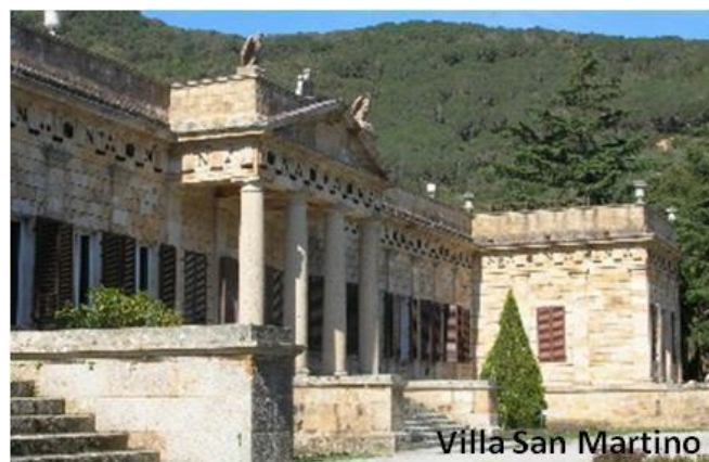
Villa San Martino

Le Palazzina San Martino (une des résidences de Napoléon 1 er ) se visite, ainsi que des musées et le palais dei Mulini.