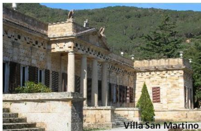
Villa San Martino

Le Palazzina San Martino (une des résidences de Napoléon 1 er ) se visite, ainsi que des musées et le palais dei Mulini.