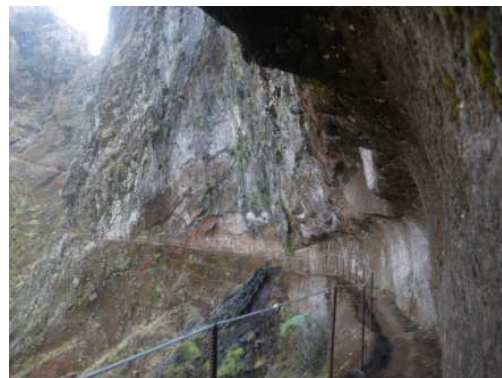
des sentiers vertigineux

A mi-chemin entre Madère et les Canaries, à 150 miles, se trouvent des îles sauvages, les îles Selvagens , débordées d'écueils. C'est là que nous mouillons et débarquons pour une visite de l'île, guidée par un des gardiens du site.