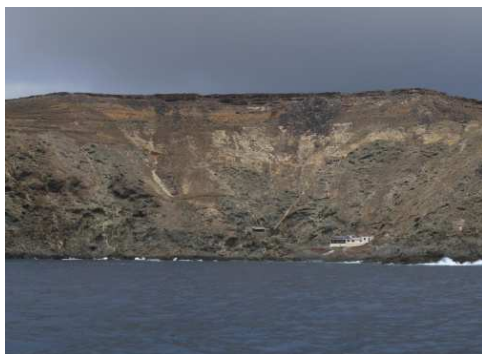
Le plus grande île de l'archipel Salvagem Grande

A mi-chemin entre Madère et les Canaries, à 150 miles, se trouvent des îles sauvages, les îles Selvagens , débordées d'écueils. C'est là que nous mouillons et débarquons pour une visite de l'île, guidée par un des gardiens du site.