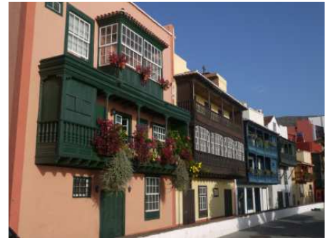
Traditionnels balcons en bois

Mardi 9/10 : Nous louons une voiture pour 15 € la journée : montée à la Caldeira de Taburiente puis randonnée pendant 1h30 dans les pins, à flanc de montagne. Un panneau rappelle qu'en novembre 2005, une dépression tropicale générant des vents de 200km/h est passée par là. Gunther s'en souvient, il était en mer à 100 miles de là, parti pour une Transat. Nous visitons ensuite le village de Taracorte, traversons une allée de bougainvilliers. La route du retour nous fait passer à travers d'anciennes coulées de lave, paysage grandiose.