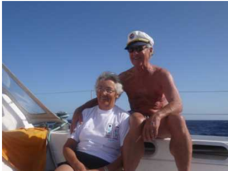
Un couple épanoui.

Lundi 8 /10 : Appareillage à 5h du matin. Au départ le vent est faible (5 nds), mais à 1 mile du port il passe à 25 nds subitement : prise de ris immédiate avec trinquette à la place du génois. Tout est sur enrouleur et la manœuvre est rapide. Nous sommes tombés dans une zone d'accélération du vent entre les îles qui créent des couloirs où le vent peut forcer de 10 à 20 nds. À 8h le vent redescend à 15 nds. A 15h30, après 72 miles, nous entrons dans le port Santa Cruz de La Palma , marina toute neuve et quasiment vide. Nous nous étonnons des toilettes en marbre et bois exotique. Superbe ! Magnifiques maisons avec de très beaux balcons en bois.