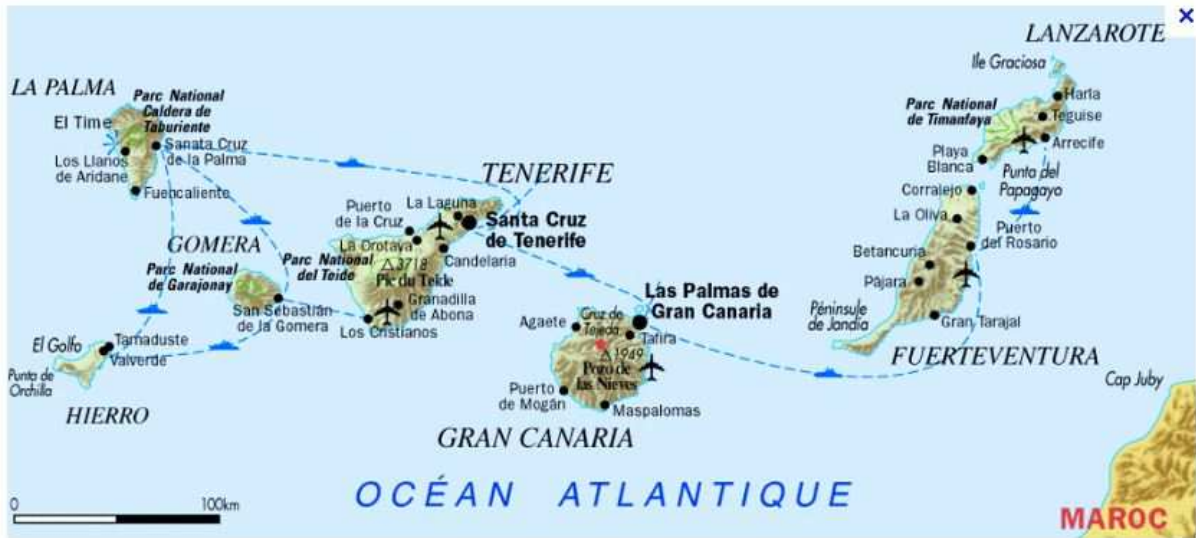
La carte des îles CANARIES