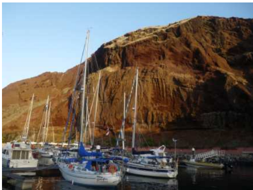
Quinta do Lorde