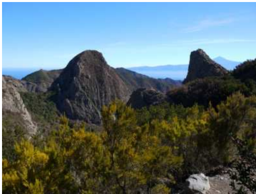
La vie reprend le dessus.

Le lendemain, dimanche, nous louons une voiture et allons à la découverte de l'île : balade dans une forêt ravagée par le feu où les fougères commencent à repousser.