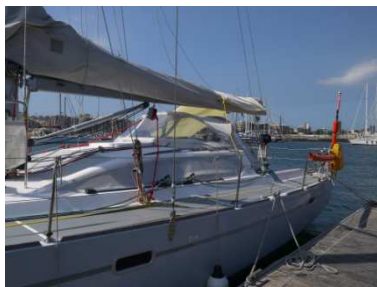
notre RM 12

Arrivé dans les îles des Canaries, le navire est amarré dans la marina de Las Palmas de Gran Canaria , dont le grand port de plaisance jouxte les ports de commerce et de pêche. Nous avons l'impression de nous retrouver en plein centre ville !