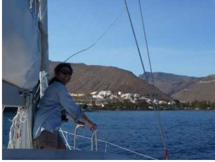
Une équipière ravie !