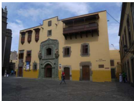
La casa de Colomb

Dimanche 14/10 : la matinée est consacrée au nettoyage du bateau. L'après- midi est réservée à la découverte de la vieille ville, la maison de Christophe Colomb où sont exposées les cartes de ses différents voyages. Nous sommes stupéfiés par la beauté et la diversité des fleurs.