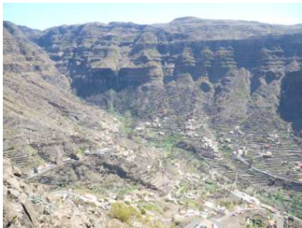
Valle Del Rey

Descente dans la fascinante Valle Del Rey le long des cultures de bananes, puis baignade dans les rouleaux de l'océan. Cette île est pleine d'un charme qui nous réjouit.