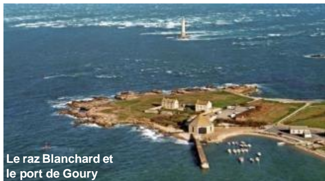
Le raz Blanchard et le port de Goury

Le port Chantereyne à Cherbourg est bien abrité derrière la grande digue extérieure et l'avitaillement est aisé. Pour débuter nous irons nous mesurer au raz Blanchard qui est plus large (8 milles) que les raz bretons, mais où la mer peut y être plus mauvaise. Il faut bien choisir son moment, habituellement on cherche à passer à l'étales qui correspond au sens du vent pour éviter le vent contre courant donnant une mer très hachée.