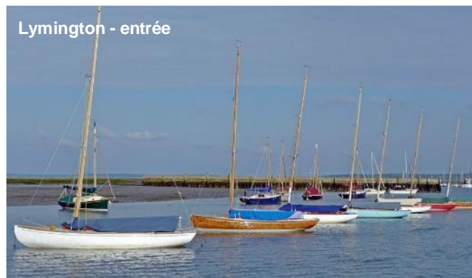
Lymington - entrée

être fait pour entrer à Lymington, Beaulieu River, ou même Yarmouth, pour varier de Cowes, dans l'île de Wight. On y retrouve l'ambiance village maritime traditionnel et des pubs « so british ».