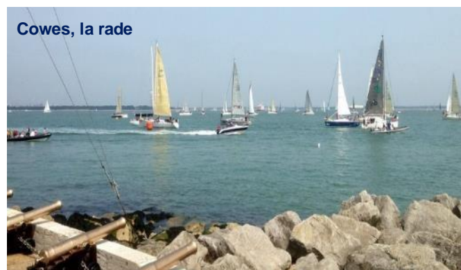
Cowes, la rade