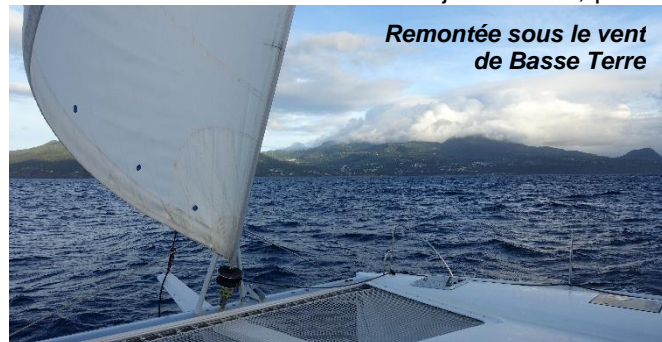
Remontée sous le vent de Basse Terre

La côte calme de Basse-Terre a de jolis attraits, parmi