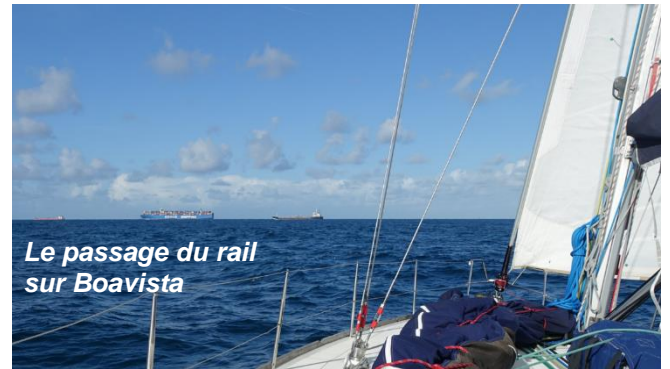
Le passage du rail sur Boavista

Cherbourg offre ses rades pour des manœuvres en attendant la bonne fenêtre météo. La traversée de Manche exige la maîtrise du routage dans les courants et une bonne organisation à bord pour les quarts (navigation, barre, repas, repos) et navigation de nuit.