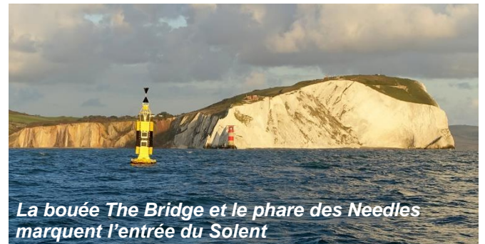
La bouée The Bridge et le phare des Needles marquent l'entrée du Solent

Le Solent est le bras de mer qui sépare l'île de Wight de l'Angleterre. Les vents affectés par le relief sont changeants, la marée est une combinaison complexe donnant des courbes très particulières. Les courants