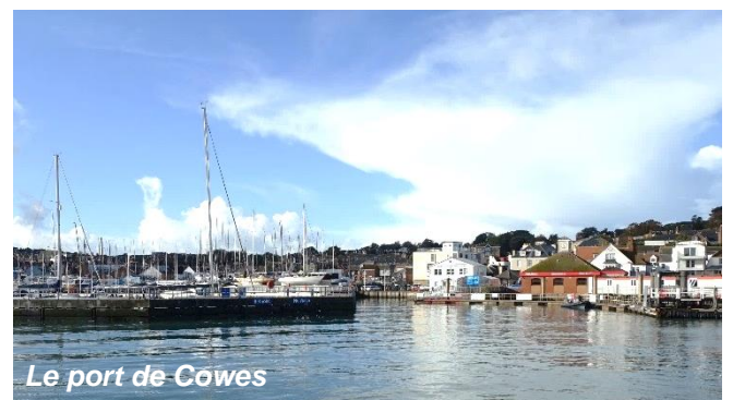
Le port de Cowes