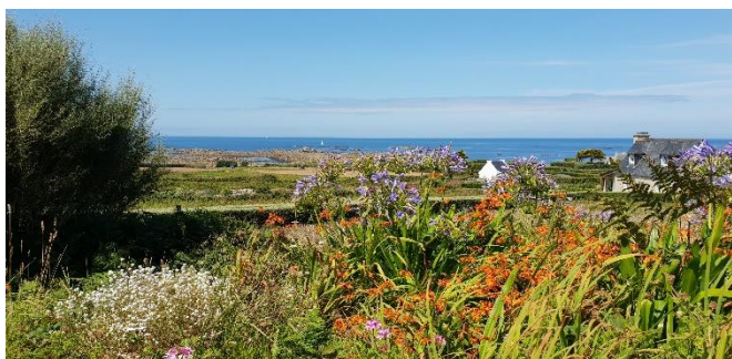
Ile de Batz

Retour au Port du Blosson à Roscoff , avec une halte possible à l'île-de-Batz , jolie balade à pied, navette à partir de Roscoff.