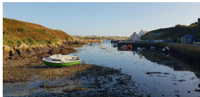
Lampaul - Ouessant