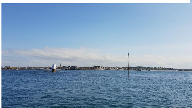
Passage entre Batz et Roscoff