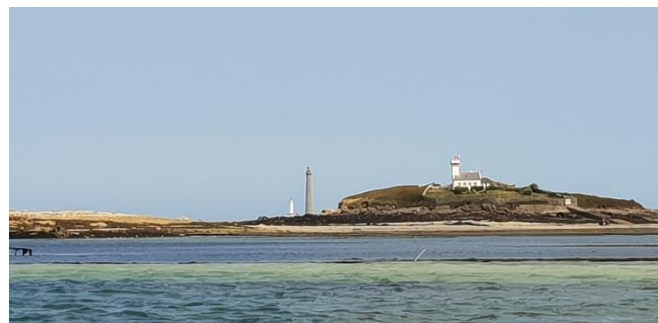
En arrivant à l'Aber Wrac'h

Avec un peu de chance météo, vous pourrez choisir de vous lancer plutôt vers les îles Scilly , atterrissage obligatoire à Saint-Mary. À décider avec votre chef de bord. Cela demande alors de vous mettre en configuration « traversée » (100 à 120M) avec passage du rail et navigation de nuit par quart