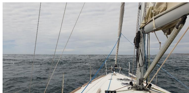
Courants du Fromveur

par le Fromveur, là encore il faudra jouer avec marée et courants entre les phares de La Jument et de Kéréon.