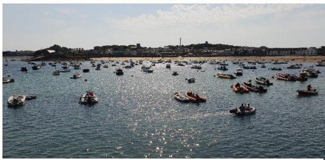
Scilly - St Mary