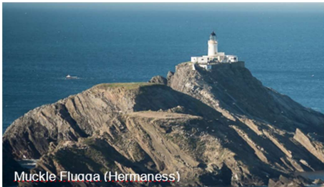
Muckle Flugga (Hermaness)

Les Orcades (Orkney en anglais – Arcaibh en gaélique écossais) : situé au Nord de l'Écosse, à 16 km de la côte de Caithness, cet archipel compte soixante-sept îles légèrement vallonnées dont seize seulement sont habitées.