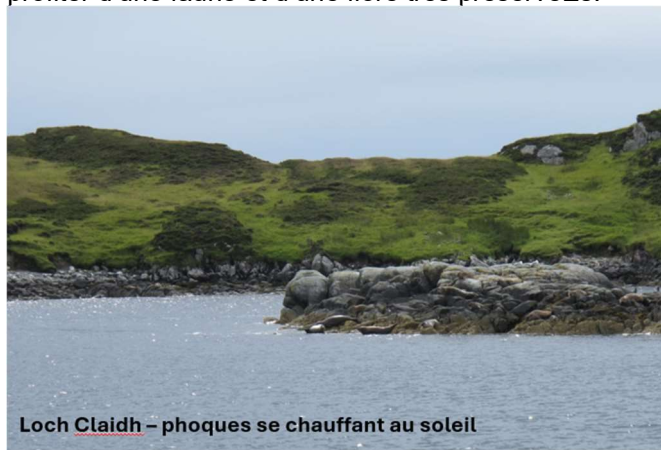
Loch Claidh – phoques se chauffant au soleil

Une nature grandiose et sauvage, des collines rocailleuses et inhabitées qui permettent de prendre un bol de culture écossaise et gaélique, de rencontrer une population au caractère rude mais accueillante et de profiter d'une faune et d'une flore très préservées.