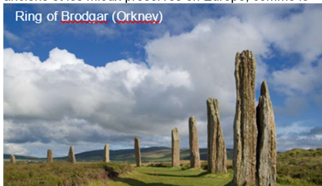
Ring of Brodgar (Orkney)

On y trouve certains des villages néolithiques les plus anciens et les mieux préservés en Europe, comme le