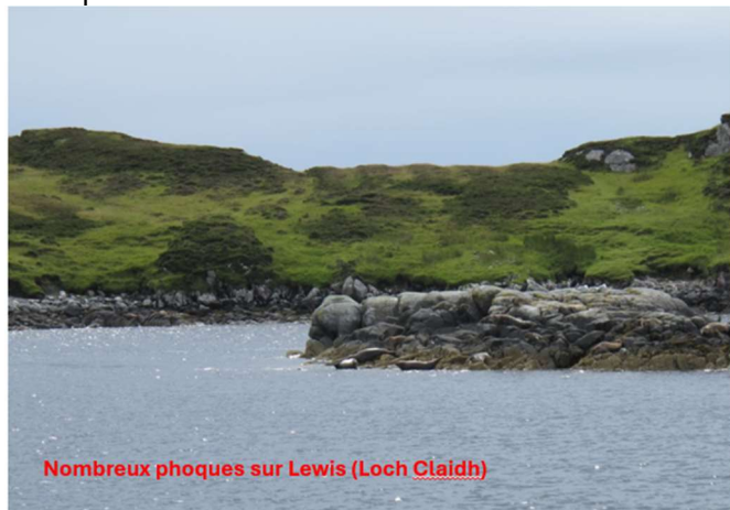
Nombreux phoques sur Lewis (Loch Claidh)

L'île de Lewis and Harris constitue la principale île de l'archipel des Hébrides extérieures.