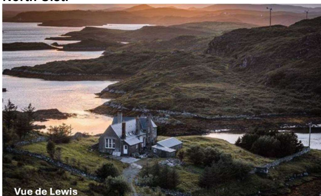
Vue de Lewis

A l'ouest de Skye, les îles de Barra , South Uist et North Uist .