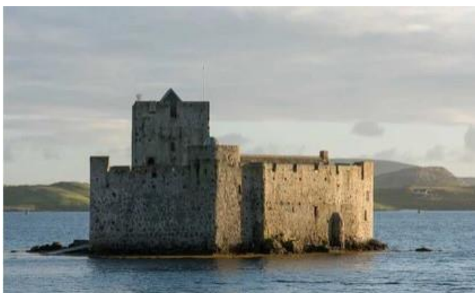
Barra : Castle bay

Tiree, Staffa avec ses orgues basaltiques