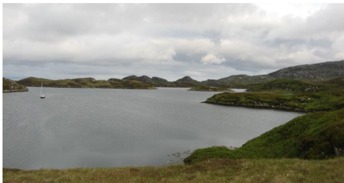
South Uist : Loch Skipport.

Ces îles peu peuplées, offrent des paysages exceptionnels au fond de lacs profonds.