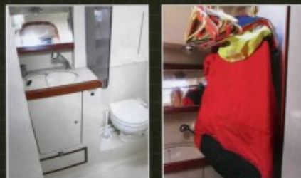
▲ Il y a trois salles d'eau, une à bâbord de la descente (gauche) et deux à l'avant, dont une aménagée en penderie (droite).