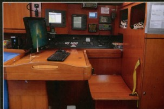
▲ La table à cartes est volumineuse et a tout le nécessaire pour la navigation : PC avec logiciel MaxSea, AIS, radar, GPS. Les nombreux rangements sont pratiques pour caler livres et matos.