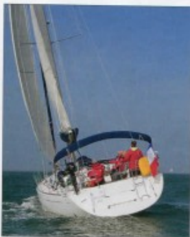
▲ Le tableau s'ouvre pour donner accès à la jupe. Le radeau est stocké dans le passage.

du carré, les cuisiniers du jour profitent du grand plan de travail. Le pot-au-feu mijote sur la gazinière trois feux pendant que la vaisselle se fait dans l'un des deux éviers. On sort les fromages qui seront dégustés en fin de repas. Le frigo de 150 l est complété d'une glacière de 100 l pour assurer le frais des grandes traversées. Tous deux s'ouvrent par le haut et auraient mérité un tiroir, ou à défaut une ouverture latérale, pour pouvoir y piocher sans avoir à tout vider.