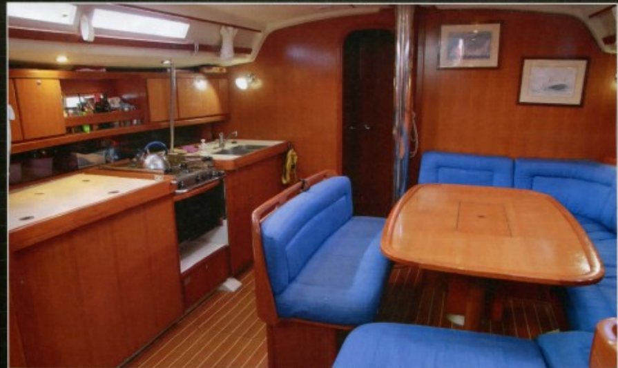
▲ Beau volume intérieur! Les selleries sont comme neuves après un nettoyage professionnel. La cuisine est fonctionnelle avec un grand plan de travail au-dessus du frigo et de la glacière. Petit bémol : il manque une main courante pour rejoindre le carré depuis la descente.