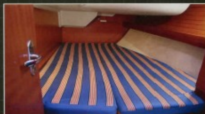
▲ Les deux cabines arrière sont identiques. Elles ont une plus grande superficie de matelas que les deux cabines avant.