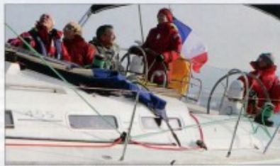
▲ La dream team de Cléo 2, prête à rejoindre les îles Scilly.

Le Groupe international de croisière porte bien son nom. Depuis plus de cinquante ans, il propose à ses adhérents des croisières hauturières sur le bateau de l'association mais aussi des locations à l'autre bout du monde. Les membres, tous équipiers confirmés, naviguent à bord d'un voilier parfaitement entretenu et équipé, sans en assumer le coût d'entretien individuellement. L'autre privilège est de pouvoir découvrir des horizons lointains et l'expérience hauturière en « one way », avec des équipiers devenus copains avec le temps. Danemark, Suède, Norvège, Écosse, Terre-Neuve, Açores... Le programme ambitieux fait le plaisir de ces jeunes retraités dynamiques qui accueilleraient bien volontiers une relève tout aussi motivée. A bon entendre ! Plus d'infos sur leur site : http://gic-voile.fr/ .