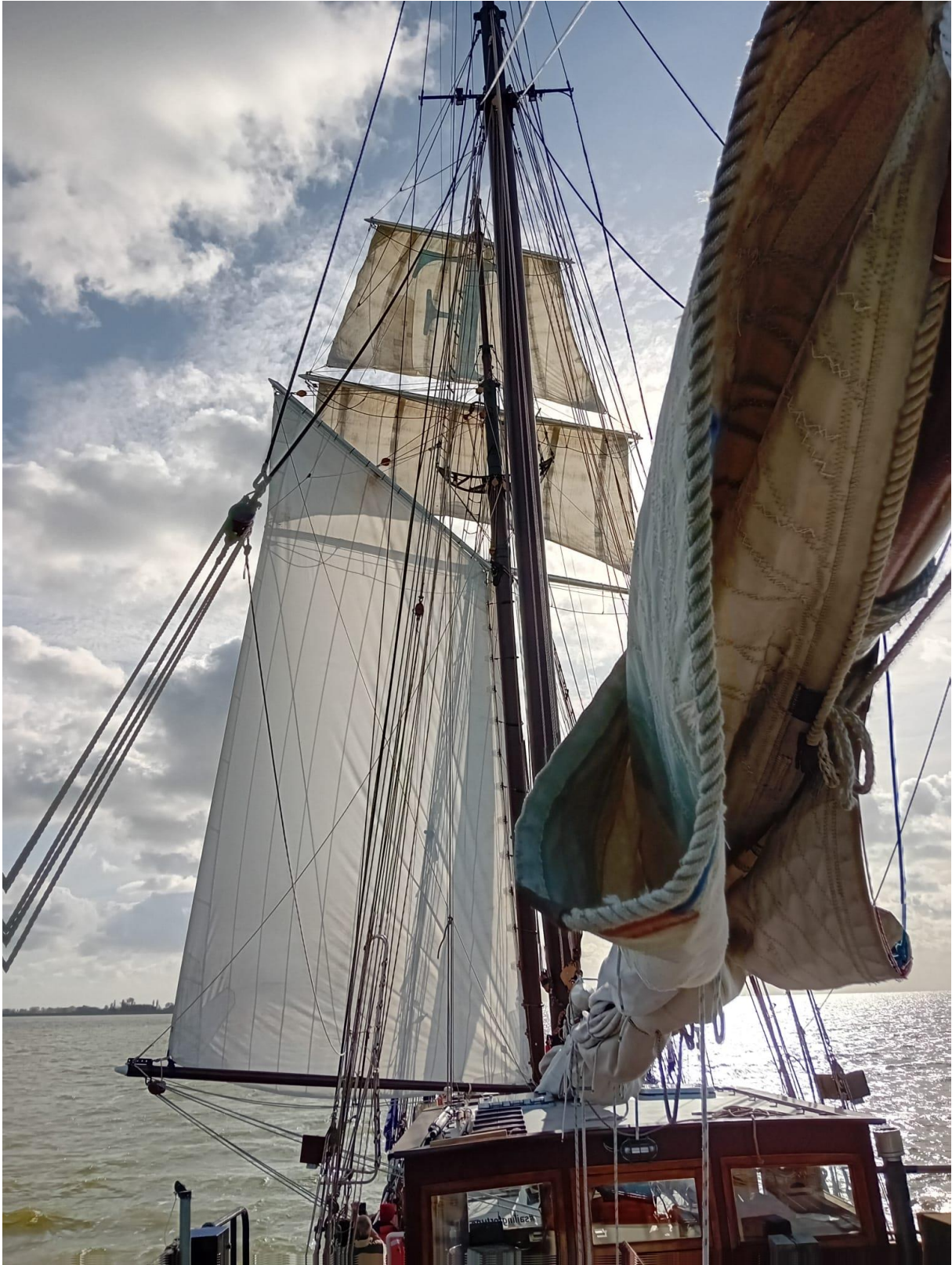
Fortuna sous voile