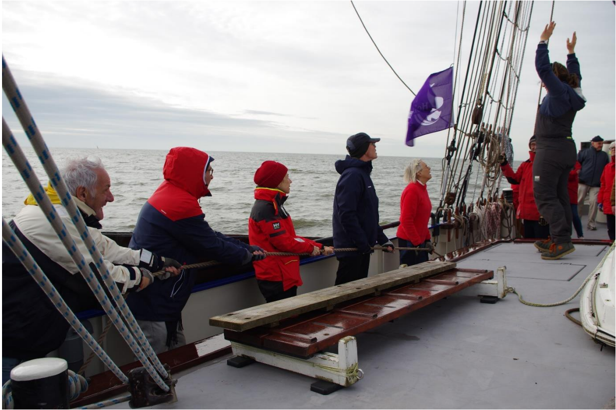
Tous à la manœuvre