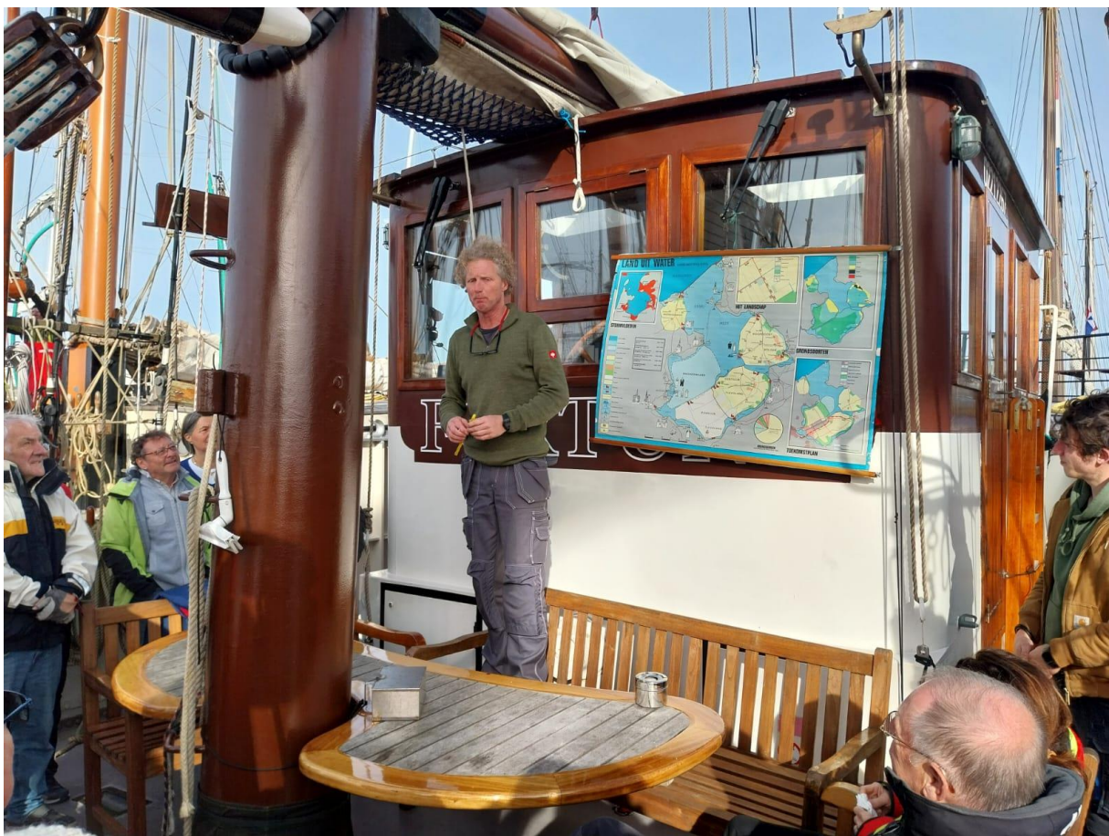
Briefing de début de croisière

Ainsi, sur le Fortuna, la plus grosse des 3 goélettes, il fallait 8 personnes pour monter la grand-voile et son pic, 6 pour déployer chaque hunier ou chacun des 3 focs ! C'est donc à la force des bras des membres du GIC que toutes les manœuvres s'effectuaient sous la conduite du matelot professionnel à bord, le skipper de chaque navire tenant la barre.