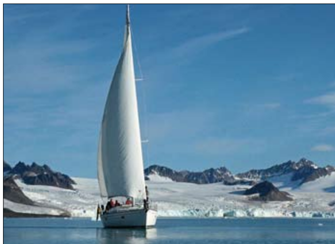
▲ Le Bavaria 46, ici devant le glacier Lilliehookfjorden, s'est révélé parfait pour le Spitzberg. D'ailleurs le GIC repart avec Boreal Yachting en 2013.