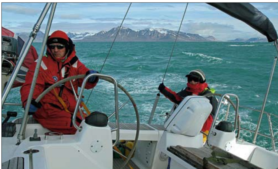
▲ Les équipages du GIC ont eu des conditions variables, avec un maximum de 25 nœuds de vent.

« Un glacier à chaque mouillage », tel était le mot d'ordre sur l'Arctic Flyer.