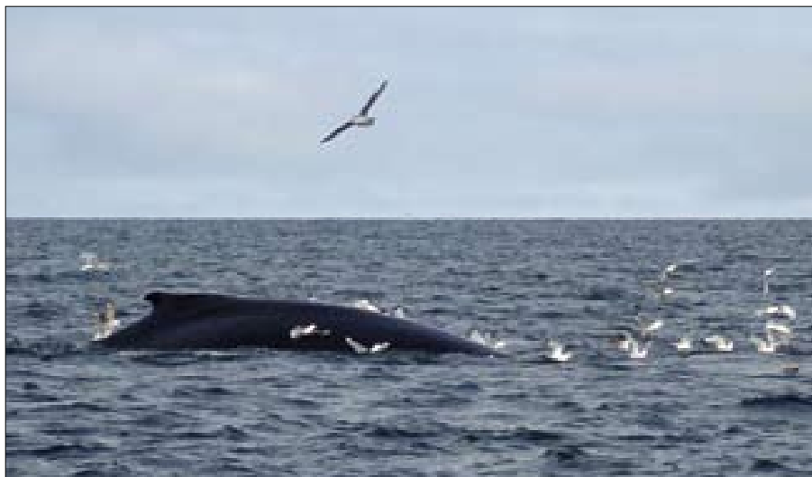
▲ Rorquals, cachalots, baleines à bosse ou franches, on voit toutes sortes de cétacés au Spitzberg.

Les équipages du GIC ont taquiné la morue avec un certain succès grâce à la ligne du bord, constituée d'un plomb de 250 g et de trois leurres en forme de crevette. Ils tentaient leur chance sur la ligne de sonde des 30 à 40 mètres. Quand la morue est là : ça mord immédiatement et il n'est pas rare de remonter des poissons de 5 kg ou plus. Quand elle n'est pas là, inutile d'insister.