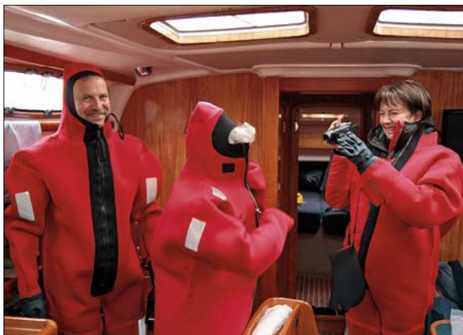
▲ On ne rigole pas avec la sécurité, mais on rigole quand même un bon coup en essayant les combinaisons sèches qui équipent le bateau.