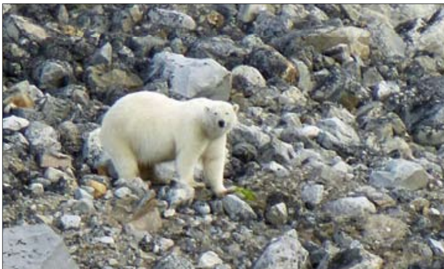
▲ L'ours polaire peut être dangereux, mais en fait c'est surtout lui qui est en danger.