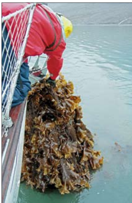
▲ La surabondance de grandes laminaires dans les fonds rend souvent les mouillages aléatoires.

Que l'on navigue au Spitzberg ou ailleurs, les règles de sécurité sont toujours les mêmes. On veillera néanmoins à les suivre avec davantage