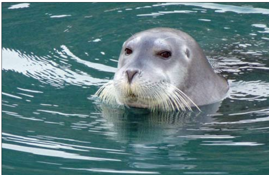
▲ Le phoque barbu est l'un des pinipèdes les plus courants, mais il y a aussi des morses.

quant à elle, est plutôt à prendre en compte lorsque l'on débarque. Fort heureusement, elle ne recouvre pas la totalité des rivages, mais quand on mouille devant un glacier, il est très tentant d'aller se promener dessus. Attention, ce genre de balade demande un peu d'équipement. Non seulement les équipages du GIC, qui comptaient quelques montagnards chevronnés, avaient prévu crampons, piolets, baudriers, cordes et broches à glace, mais ils s'étaient même entraînés préalablement sur la mer de Glace. Ce n'est pas une obligation, mais une chose est sûre : la marche sur glacier ne s'improvise pas.