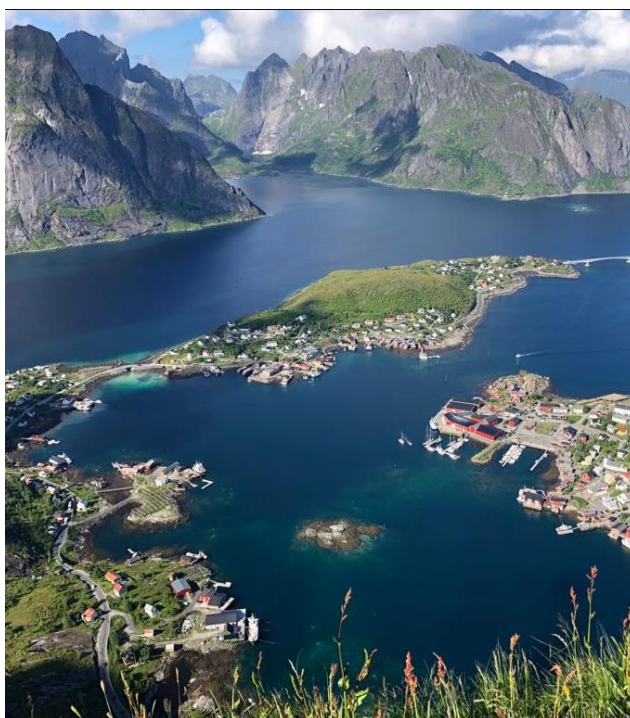
Ville de Reine en Norvège

Comme beaucoup d'entre vous le savent, Boavista a été victime d'un incident qui a endommagé son appareil à gouverner lors de sa montée en Norvège. Il est maintenant en réparation à Caen et reprendra bientôt du service. Dans cette attente, nous avons loué des bateaux sur place en Norvège pour assurer le programme prévu. Ces voiliers donnent toute satisfaction aux équipages et les croisières en Norvège révèlent des paysages magnifiques.