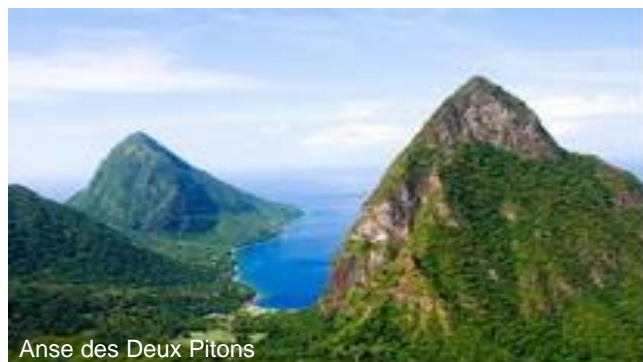
Anse des Deux Pitons

Sainte-Lucie est considérée comme la plus belle des îles des Petites Antilles. Fabuleux sites inscrits au patrimoine mondial de l'UNESCO, dont les Deux Pitons qui résultent d'anciennes éruptions volcaniques. Forêts tropicales, cascades, lagons turquoise et autres plages idylliques. A découvrir : les Diamond Botanical Gardens, les sources thermales et les chutes d'eau de la forêt tropicale, l'exploration de l'île à cheval et l'observation des tortues