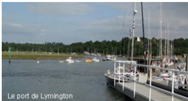
Le port de Lymington

A l'intérieur du Solent se trouvent d'autres excellentes escales, notamment Yarmouth (sur Wight), Chichester, Lymington et la Beaulieu River (sur le continent).