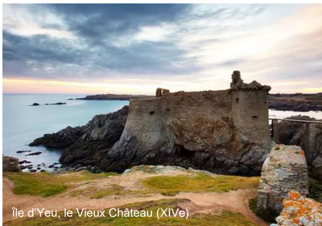
Île d'Yeu, le Vieux Château (XIVe)

Port Joinville, très abrité par tous vents, la pointe des Corbeau et l'anse des Vieilles protégé des vents de Nord-Ouest à Nord-Est ainsi que l'entrée du Port de la Meule.