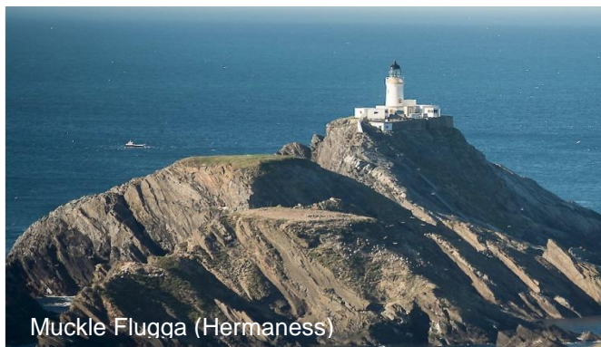
Muckle Flugga (Hermaness)