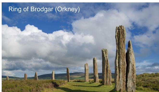
Ring of Brodgar (Orkney)

connu deux évènements maritimes importants qui se sont déroulés dans la baie de Scapa Flow : le sabordage de la flotte allemande en 1919 et le torpillage du cuirassé britannique Royal Oak par un sous-marin allemand en 1939.