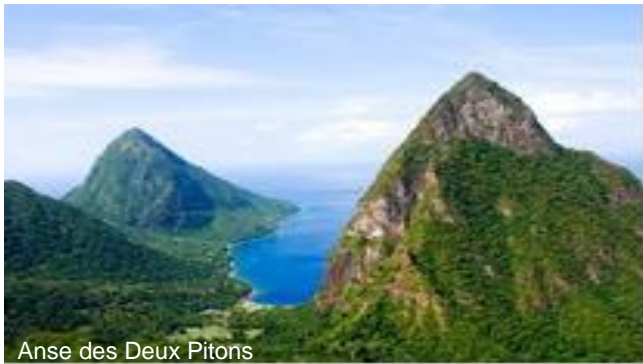
Anse des Deux Pitons