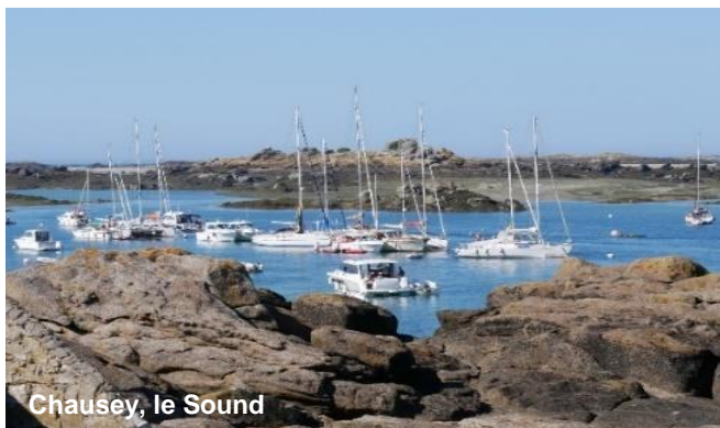
Chausey, le Sound

Les îles Chausey, balade à pied sur la Grande Île, traversée de l'archipel par ses chenaux.