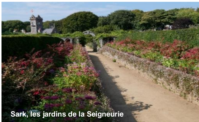
Sark, les jardins de la Seigneurie

Serq , ses vélos, ses magnifiques jardins et chemins creux, et ses « tea and scones ».