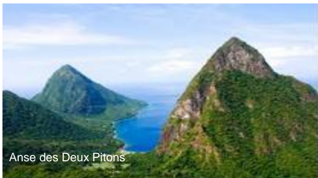
Anse des Deux Pitons

au Sud : Bequia, Petit Nevis, Moustique, Canouan, Mayreau, Union ou Petit Saint Vincent, puis Grenade.