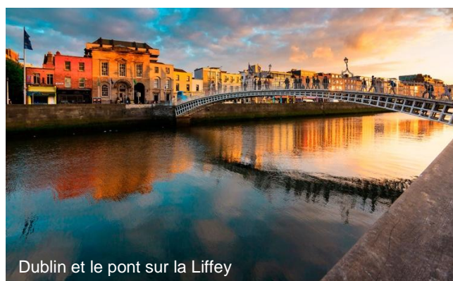
Dublin et le pont sur la Liffey

La côte Galloise avec ses noms de lieux imprononçables.