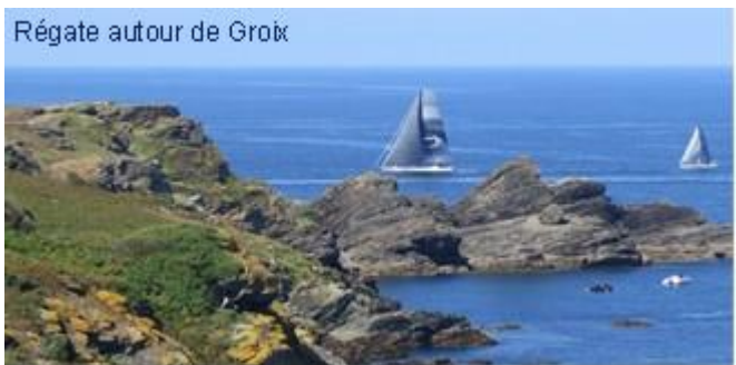
Régate autour de Groix

A Port-Louis où il y a une marina agréable à côté de la Citadelle en face de Lorient, visitez le musée de la Compagnie des Indes et celui de la SNSM, cela vaut la peine, quitte à prendre le ferry à Lorient.