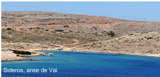
Sideros, anse de Vai

De Kassos , traversée de 35 Mn vers la pointe NE très ventée de la Crète, à Sideros , puis un autre beau mouillage, le lagon de Spinalonga sur la côte NE, avant de faire route vers Héraklion.