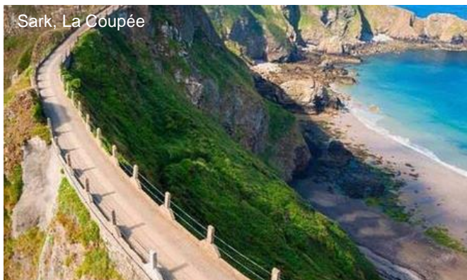
Sark, La Coupée

Prendre une calèche ou marcher quelques km, jusqu'à la Coupée, étroit passage entre les 2 parties de l'île avec un vertigineux aplomb de 80m.