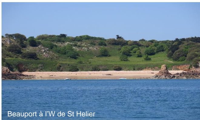
Beauport à l'W de St Helier

A Jersey la marina de St Hélier ne constitue pas une escale inoubliable mais la ville réunit toutes les caractéristiques anglo-normandes. Si vous avez le temps de mouiller à Beauport ou St Brelade juste à l'ouest la beauté des sites de granit rose vous marquera.