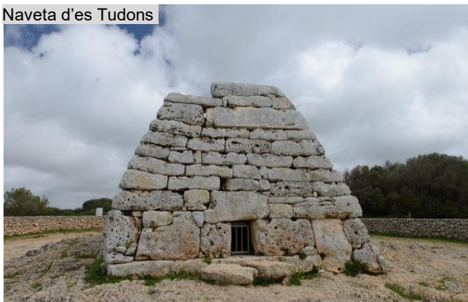
Naveta d'es Tudons

La vieille ville, autour de Es Born, l'ancienne place d'armes de la citadelle médiévale, est sillonnée de rues d'époque bordées de palais, d'églises et de forteresses. La cathédrale de style gothique catalan a été construite au 14ème siècle à l'emplacement de la grande mosquée arabe (le minaret a été transformé en clocher). Le Bastió de Sa Font est l'un des cinq bastions qui faisaient partie des anciennes fortifications du 16ème siècle. Elles abritent aujourd'hui le Musée municipal et une exposition sur la Réserve de la biosphère de Minorque.