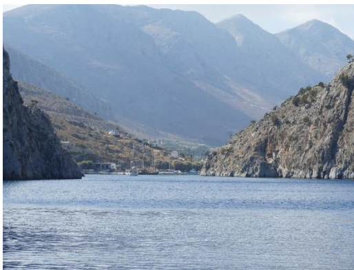
Kalimnos - Vathi

C'est une île au relief très élevé qui offre de nombreux mouillages, comme celui de Vathi au fond d'une gorge étroite.