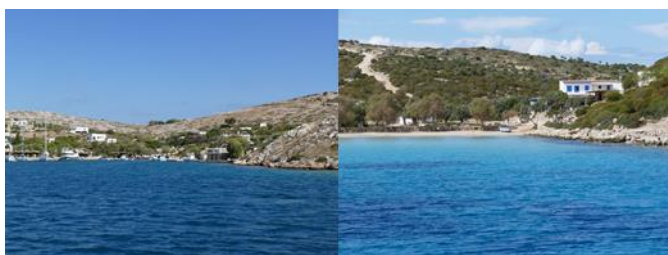
Arkoi - Port Augusta

Ces deux petites îles au sol rocaillieux recouvertes de garrigue et d'oliviers gardent un caractère authentique.