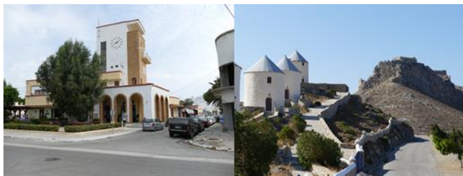
Hôtel de ville de Lakki

italienne dans l'entre-deux guerres, offre un des meilleurs abris de la Méditerranée. La petite ville de Lakki est un bel ensemble d'architecture « art déco » construit par deux architectes italiens sous Mussolini.