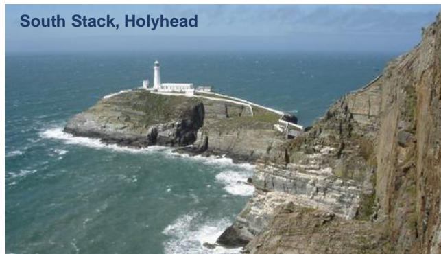
South Stack, Holyhead

On part ensuite vers la côte Galloise avec ses noms de lieux imprononçables. Le phare de South Stack nous guide pour arriver à la marina de Holyhead , au bout de la péninsule d'Anglesey. L' île de Man , dont le seigneur est Elisabeth II, arrivée à Castletown au Sud ou au port de Douglas, la capitale de l'île en remontant vers le NE.