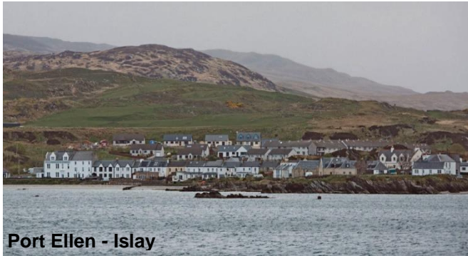
Port Ellen - Islay