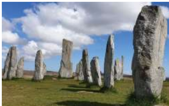
Ile de Lewis – Hébrides