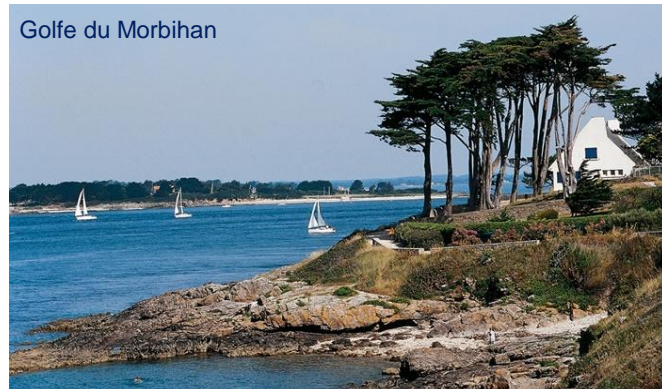
Golfe du Morbihan

Port du Crouesty , une étape confortable pour faire un changement d'équipage. A voir le Tumulus de Tumiatic, l'île au Moine, le Cairn du Petit Mont, le Moulin à Marée de Pen Castel.