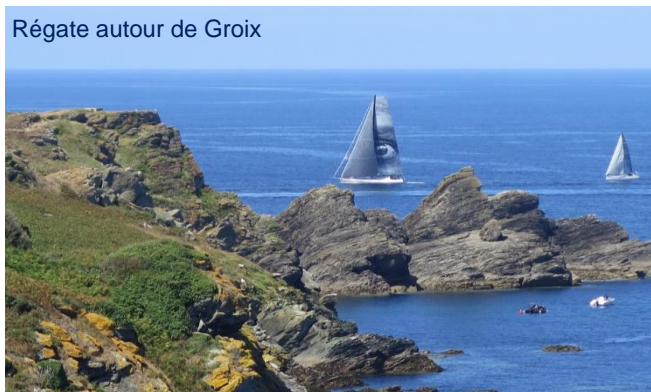
Régate autour de Groix

Belle-île : Mouillez à Sauzon pour son port charmant et allez jusqu'à la grotte de l'Apothicaierie à la pointe des Poulains. Au Palais , visitez la citadelle, dégustez une excellente beurrée belliloise et prenez un pot au Goéland, dans une ambiance très british.