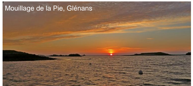
Mouillage de la Pie, Glénans

Concarneau : Marina commode. On peut aussi flâner