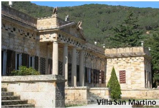
Villa San Martino