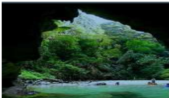
Koh Muk et sa célèbre Grotte Emeraude

A 50 milles plus au sud, la grande île montagneuse de Tarutao , 1 er parc national de Thaïlande en 1972, est