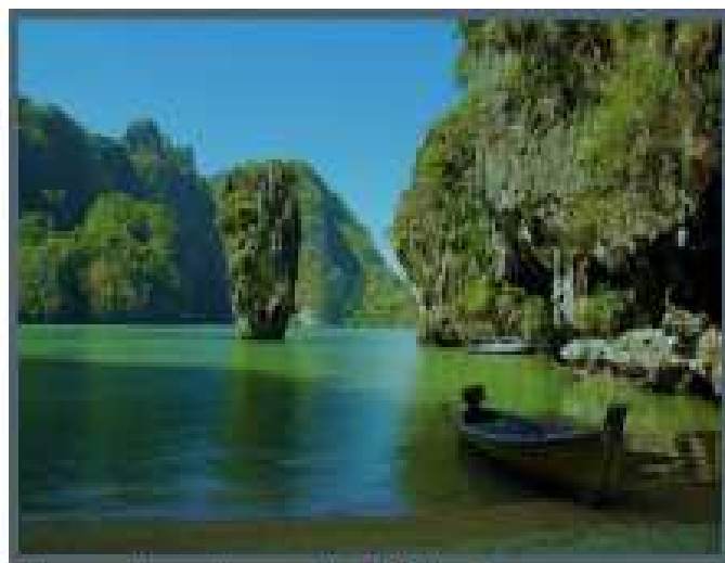
Baie de Phang Nga

Ne pas manquer : Koh Hong au magnifique lagon intérieur, Koh Phing Kan (James Bond Island où fut tourné l'Homme au pistolet d'or) et le village sur pilotis de Koh Pan Yi habité par des pêcheurs musulmans.